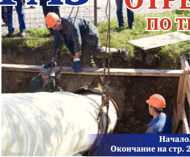
Начало. Окончание на стр. 2

Начиная с понедельника, 20 июня, в Вязниках и окрестных населённых пунктах ожидается отключение газа. Причём в некоторых городских микрорайонах голубого топлива не будет почти неделю. Не трудно догадаться, что параллельно с отключением газа жителям придётся обходиться без горячей воды. Как бы то ни было, по заверениям сотрудников вязниковского филиала компании «Газпром газораспределение Владимир», перебои с поставками голубого топлива - мера вынужденная.